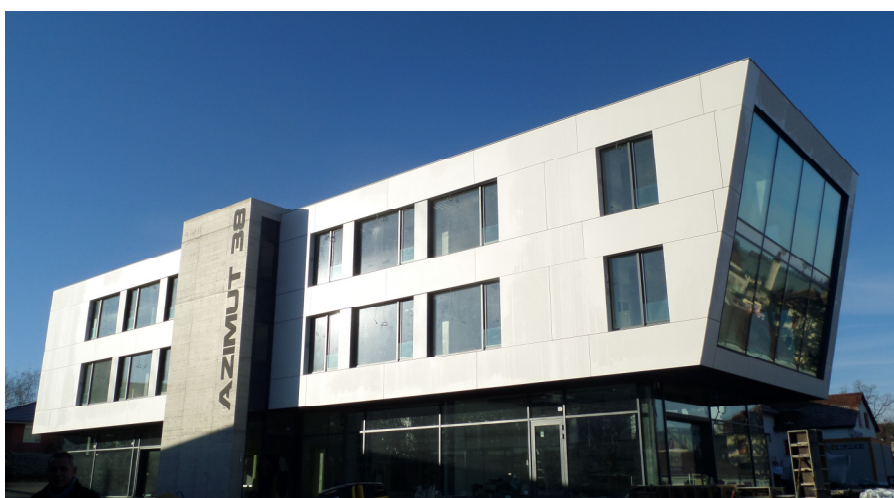
Le bâtiment Azimut 38, qui accueille les trois services d'Ajoie, est situé à la route de Courgenay 38 à Porrentruy

Pour vous inscrire ou vous désinscrire à la newsletter : info@fasd.ch